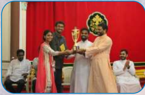
Debate Competition - 1st prize, Thane