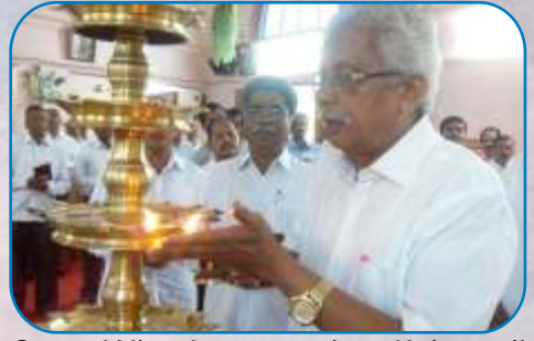
Gents Wing Inauguration, Kalewadi