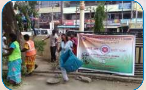
NSS Clean Campus Drive, MGC - Chennai