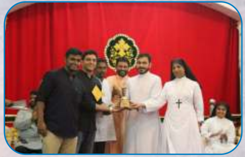
Debate Competition - 2nd prize Ulhasnagar