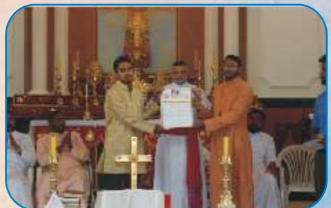
The Inauguration of Exarchial & Pune District Annual Agenda