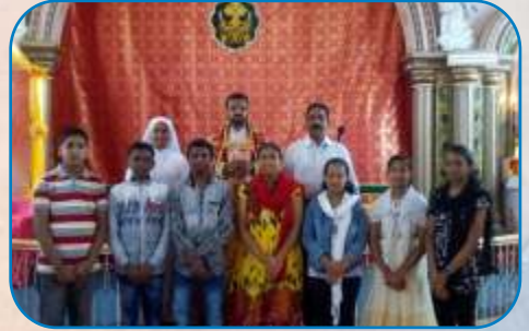
MCCL Committee Members, Kalewadi