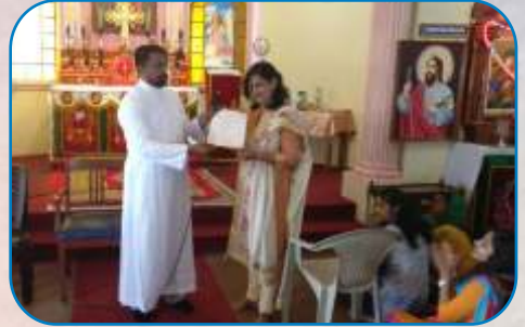
Mathru Sangham Yearly Planner Release, Vishrathwadi