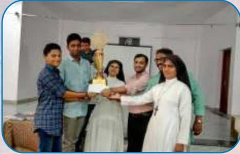
Mar Ivanios Quiz, Padi - Chennai