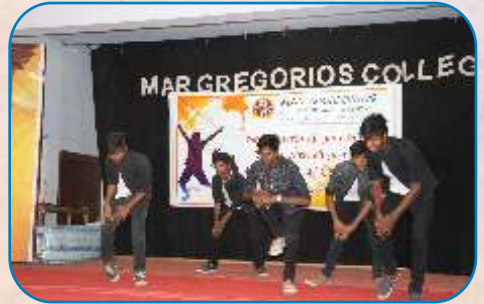
Fresher's Day-Mar Gregorious College, Chennai