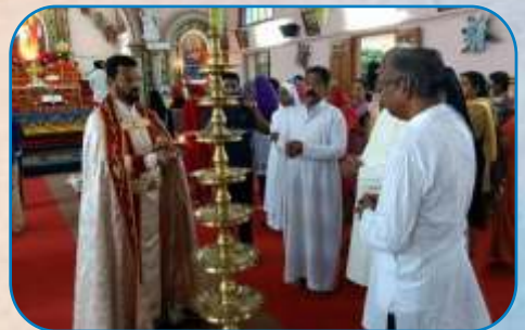
Parish Level Suvisesha Sangham Inauguration, Kalewadi