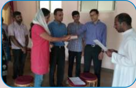
Oath Taking Ceremony, Carmalaram