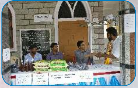
Church Construction Fund Raising Program, Carmalaram