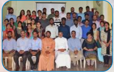
Seminar on Entrepreneurship, Pune