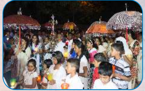
Festal Celebrations at Cathedral Church, Khadki