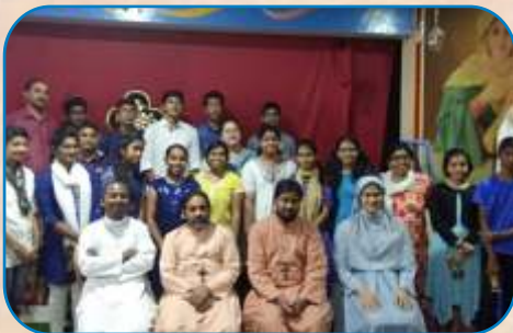
MCCL Quiz, Mathikare