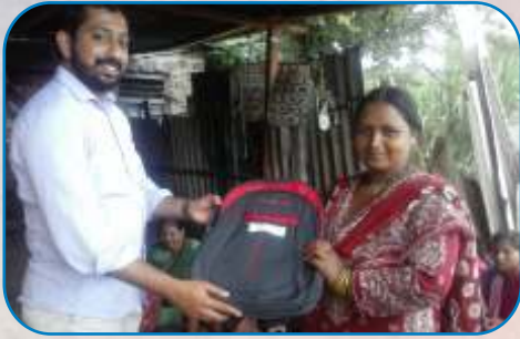
Educational Aid for SEVA Kids by St John's Marthoma Community, Khadki