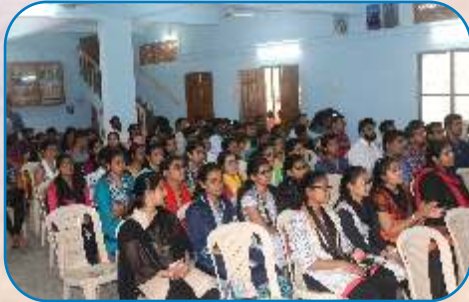
Seminar on Lectio Divina & Youth Psychology, Pune