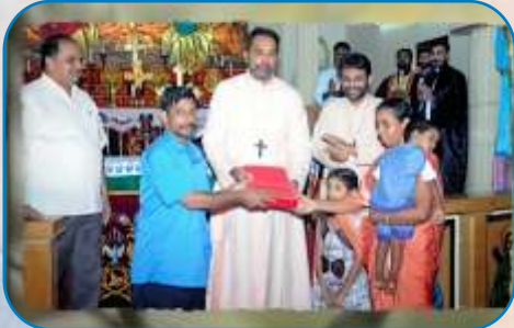
A Home for the Homeless, Kharghar