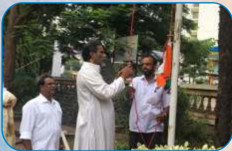
Independence Day Celebration, Warje Malwadi