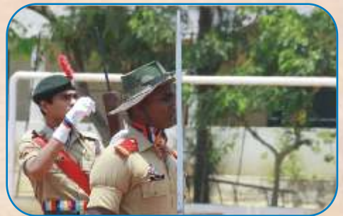
Kargil War Memorial Day-MGC, Chennai