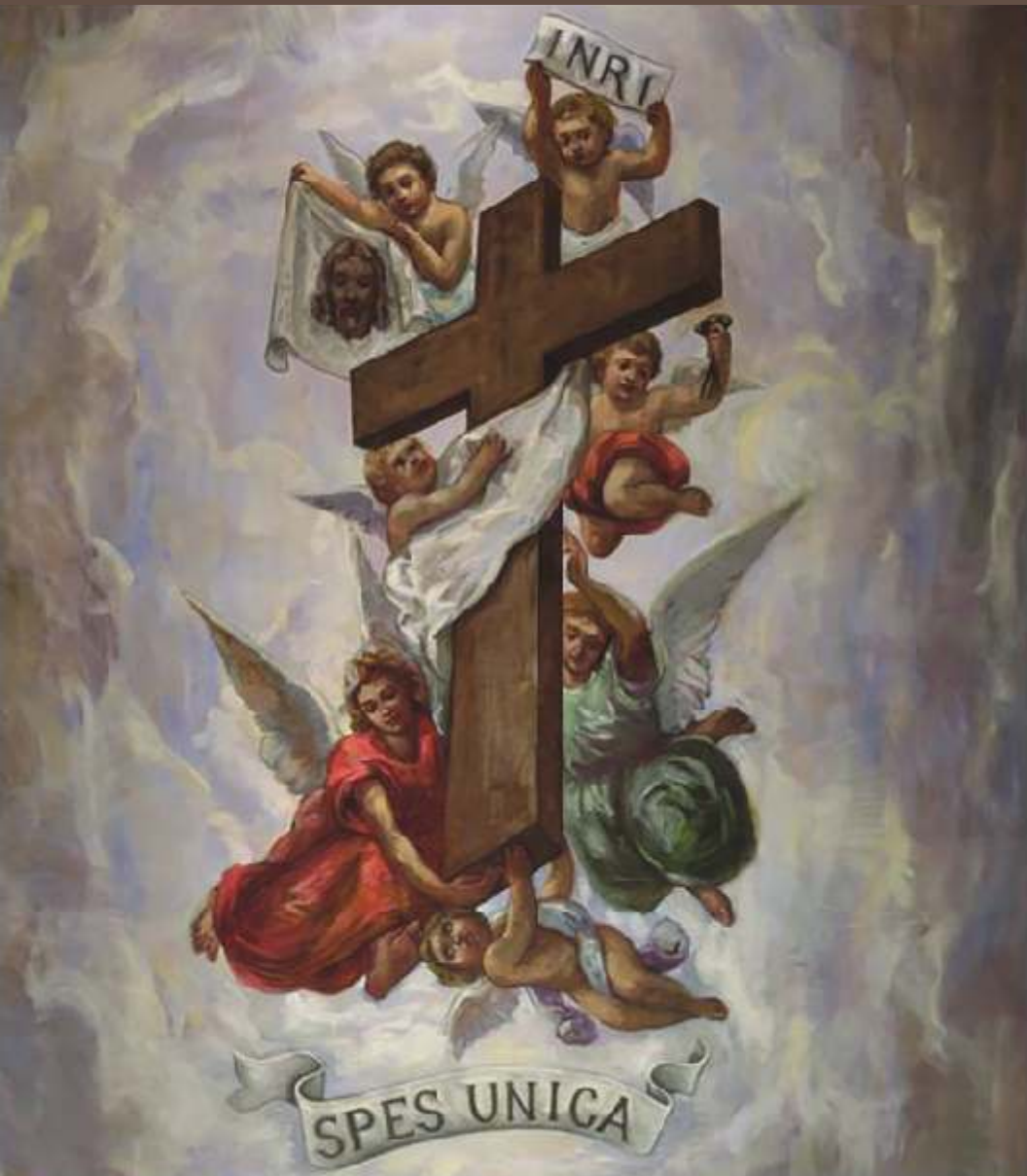
The Exaltation of the Cross