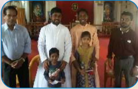
Education Aid, MCA - Ulhasnagar