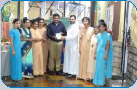
Books Exhibition - Malankara School, Sakinaka