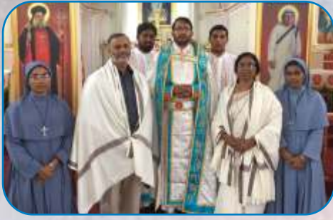
Felicitations of Suvisesha Sangham Members, Warje