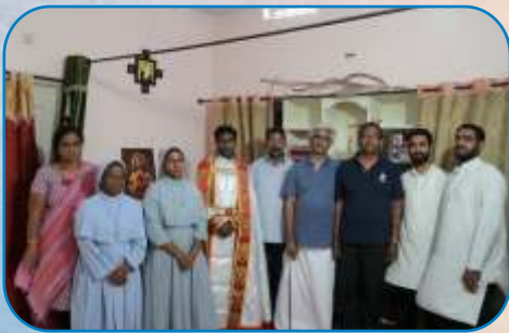
The Missionaries and the Community at Bapatla, Vijayawada