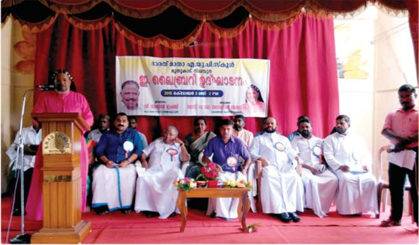
മുതുകാട് ഭാരത് മാതാ എ.യു.പി. സ്കൂളിലെ ഇ-ലെബ്രറി ഉദ്ഘാടന വേദിയിൽ അഭിവാദ്യ പിതാവ് പ്രസംഗിക്കുന്നു