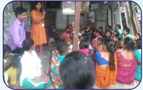
Digital Literacy Program