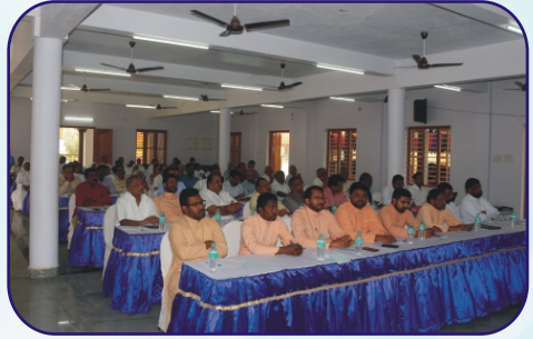
Pastoral Council Members