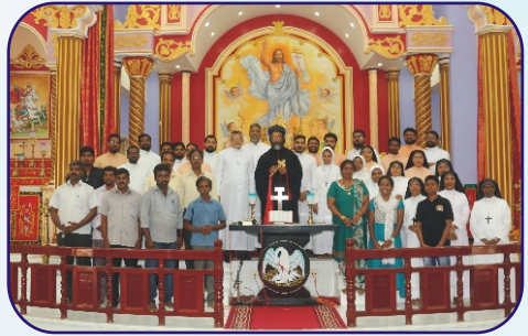
At St George MSCC, Ayappakam