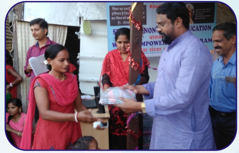
Distribution of Christmas Gifts