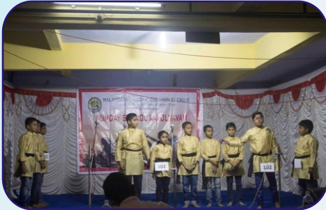
Catechism Children and Mathrusangham, Vasai