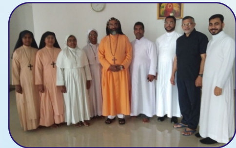
Priest - Religious Meet at Padi, Chennai