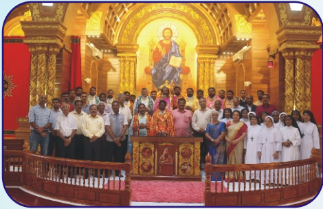
At St Thomas MSCC, Padi